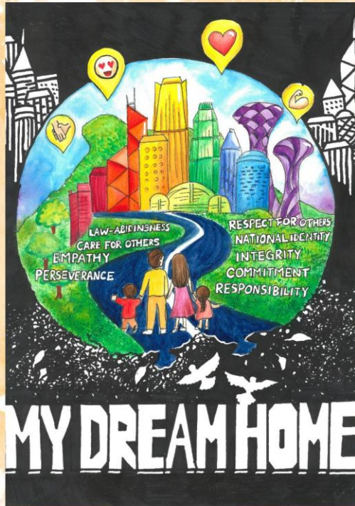
冠軍 馮康翹 屯門官立中學