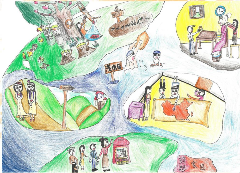
冠軍 馮凱然 廣州市天河區冼村小學