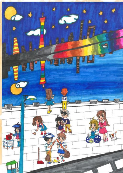
冠軍 李澍 廣州市天河區冼村小學