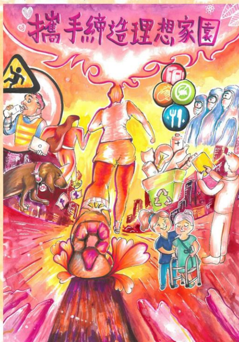
冠軍 陳曉晴 中華基督教會基元中學