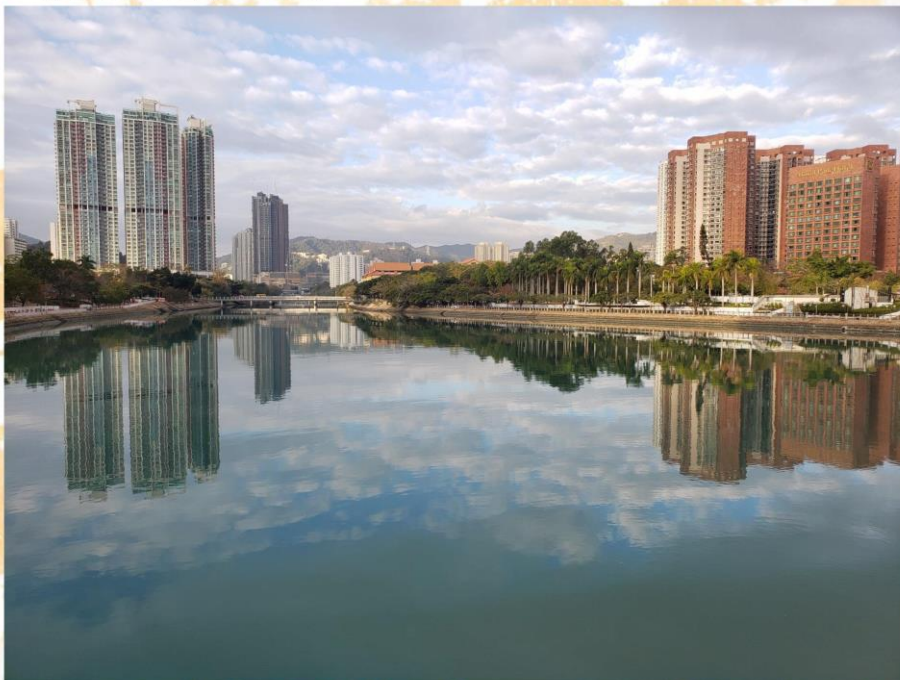
冠軍 馮子騫 沙田圍胡素貞博士紀念學校