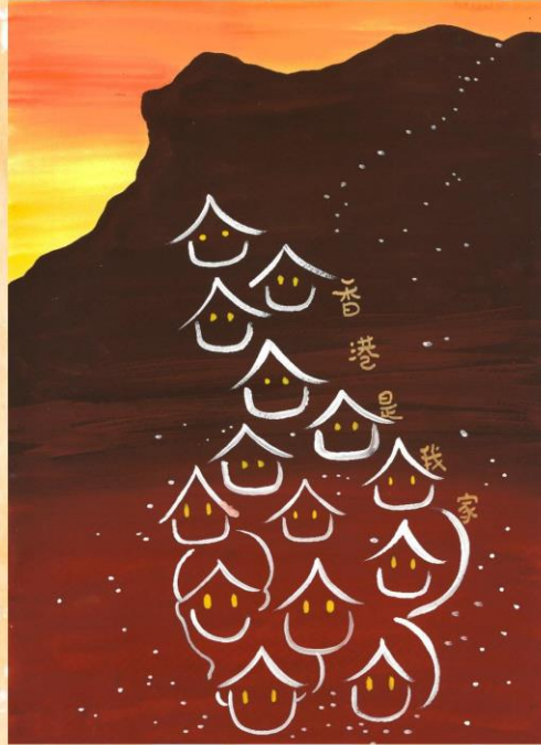
冠軍 曾汝謙 播道書院